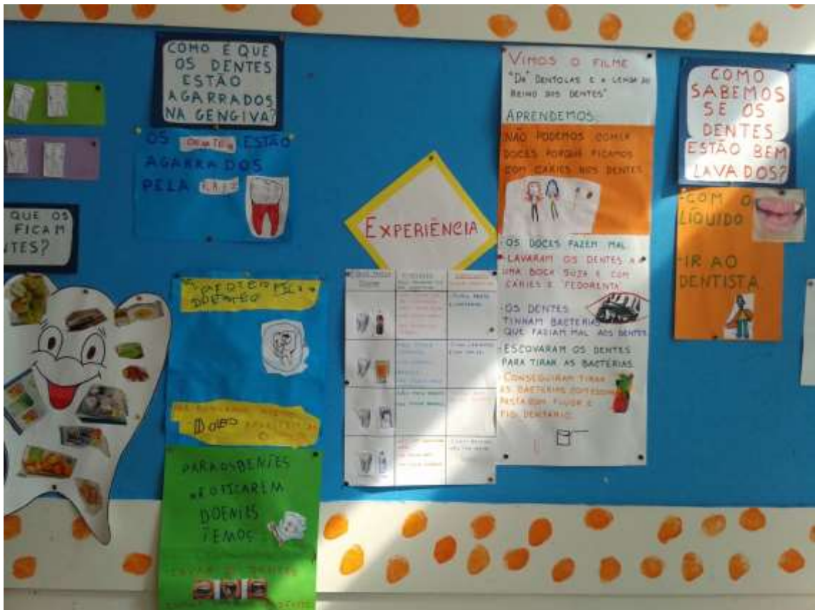
Nesta parte do quadro elaborado, foi colocada a experiência que foi realizada com os alunos e os seus resultados, o resumo de algumas atividades realizadas, bem como algumas conclusões.