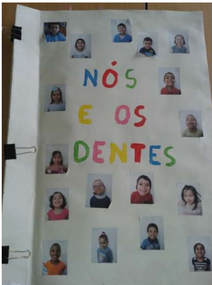
Jardim de Infância da Escola Básica Mestre Querubim Lapa, do Agrupamento da Marquesa de Alorna, apoiado pelo Agrupamento de Centros de Saúde Lisboa Norte