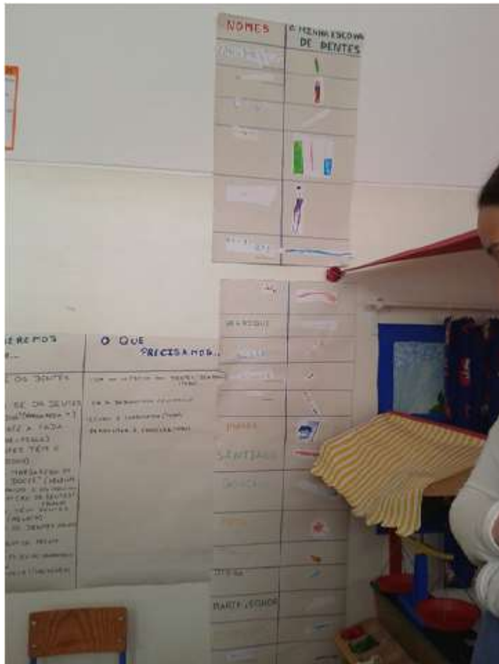
Este quadro que os alunos elaboraram, corresponde à imagem da sua escova e pasta de dentes que têm em casa.