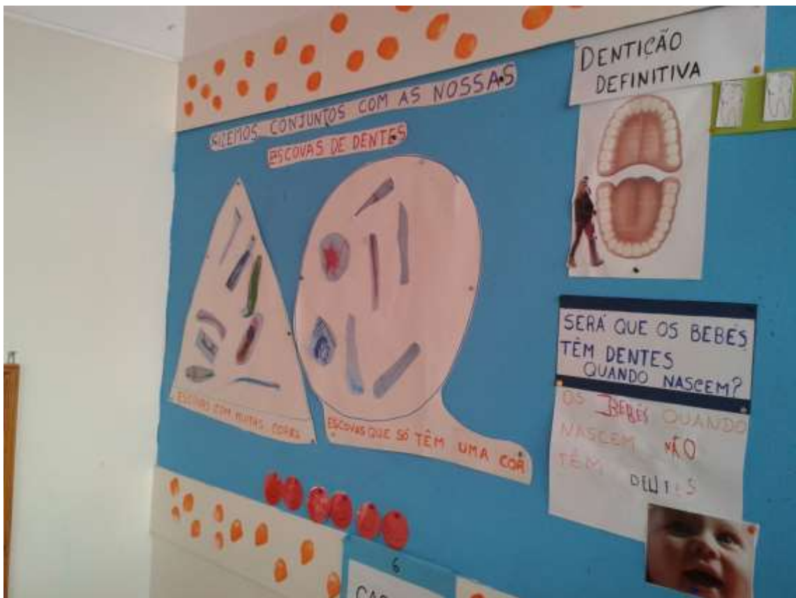
Aqui os alunos trabalharam a cor das escovas e colocaram-nas por cores...